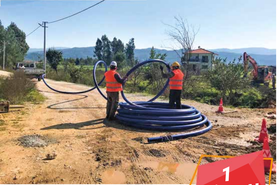
Gökova Mahallesi Terfili Kanalizasyon Hattı Yapımı