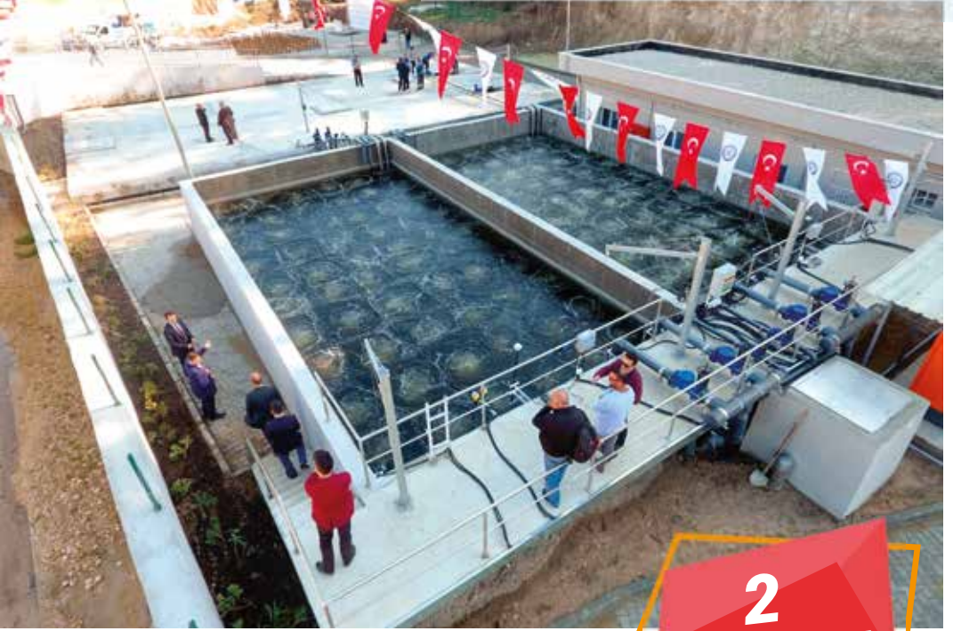
Eşen Atıksu Arıtma Tesisi