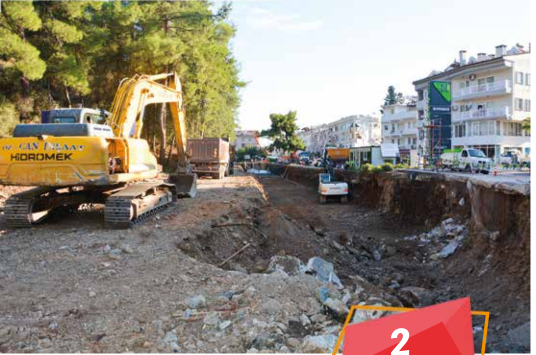
Marmaris ilçesi Değirmendere Islahı