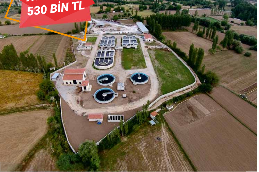
Yatağan Atıksu Arıtma Tesisi