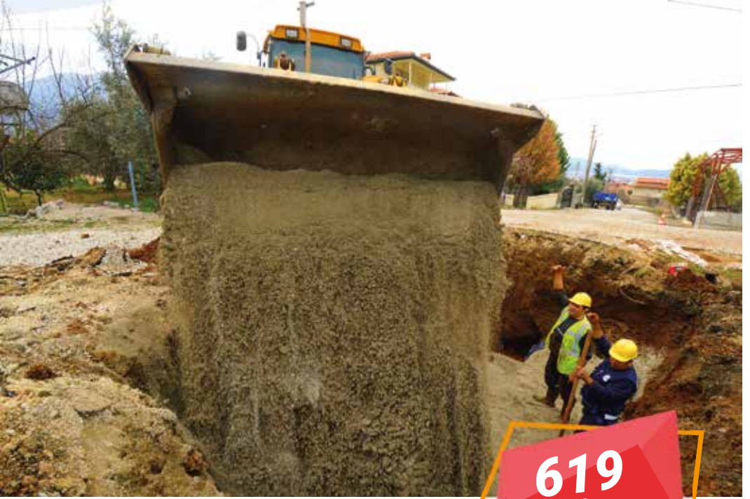
Çökek ve Bayır Mahalleri İçme Suyu İnşaatı