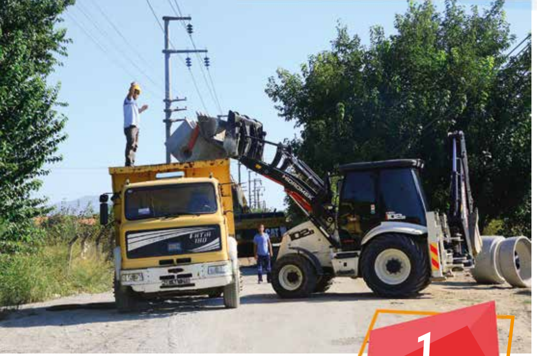
Ortaca İlçesi İçme Suyu Hattı Yapımı