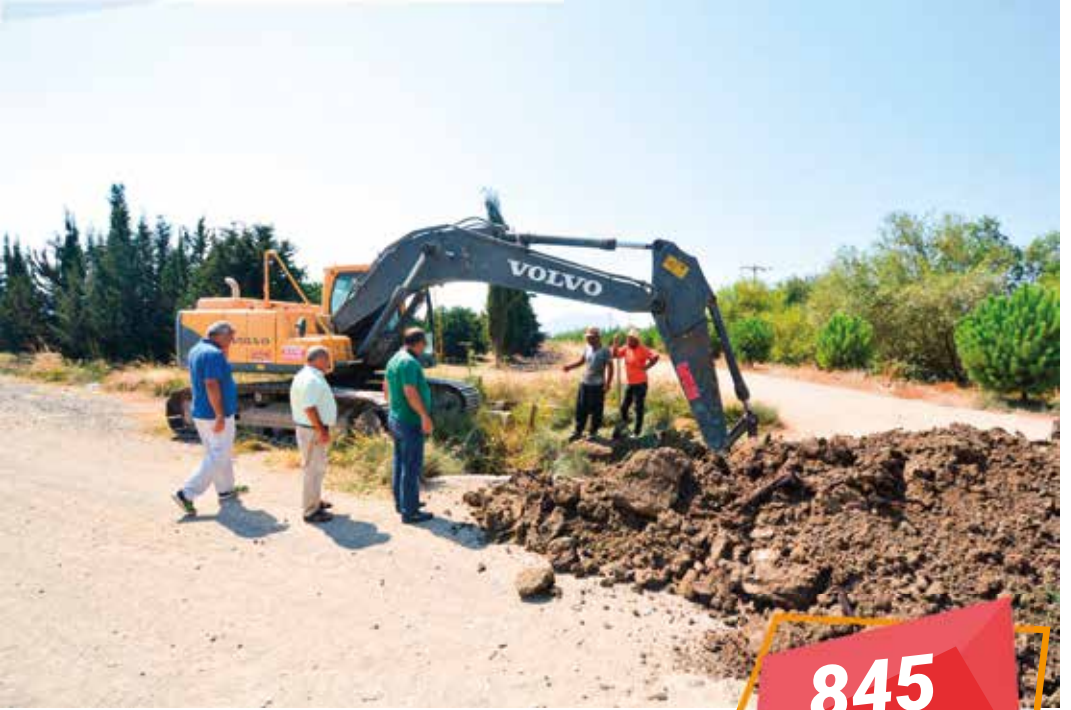
Dalaman İlçesi Kapıkargın Mahallesi İçme Suyu Yapım İşi