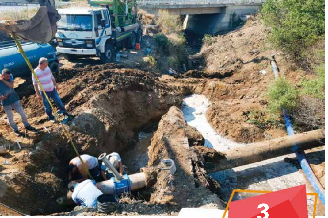
Datça İlçesi Merkez İçme Suyu Terfi Hattı