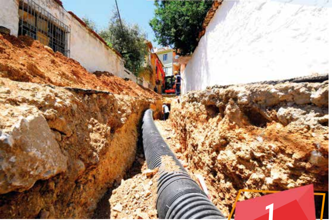
Marmaris Beldibi Mahallesi Bağla İçi Mevki Yağmur Suyu Hattı