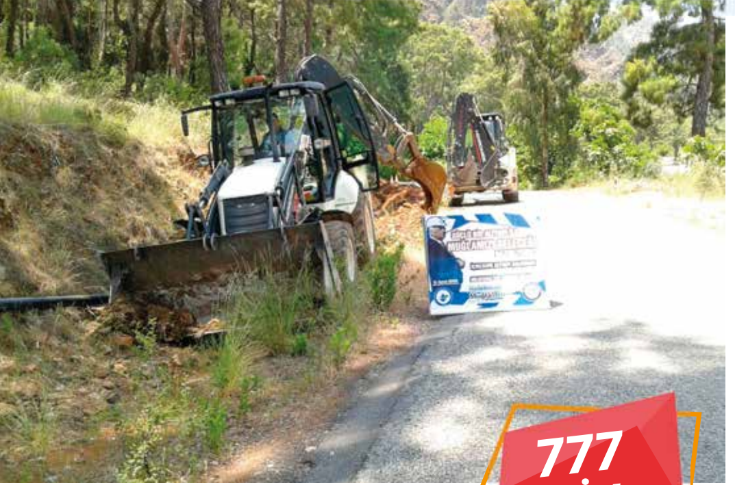
Fethiye ilçesi Göcek Mahallesi içme suyu hattı